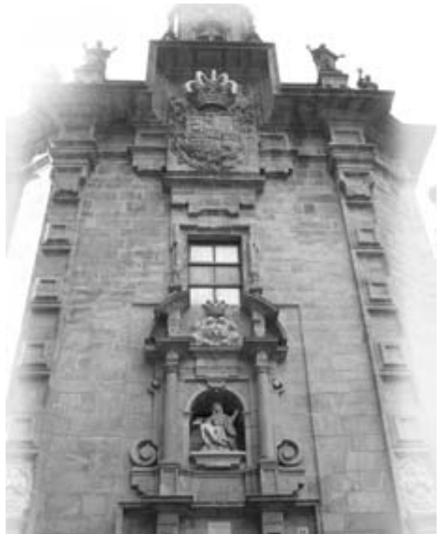
Igrexa das Angustias. Santiago de Compostela

Outros traballos de menor envergadura na obra de Ferro Caaveiro foron os que realizou na ponte e no camiño do Sar (1756). Tamén traballou na Nosa Señora do Carme de Abaixo, obra realizada a disgusto do arquitecto, pola baixa calidade dos autores que materializan a obra. Outra colaboración de Ferro Caaveiro será a que faga no Hospital Real de Santiago, obra rematada no 1766 e adaptada a unha planta preexistente. Por último contribúe á remodelación de San Lourenzo de Trasoutos (tamén en Santiago).