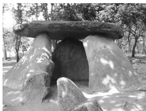
Anta de Axeitos (Ribeira)