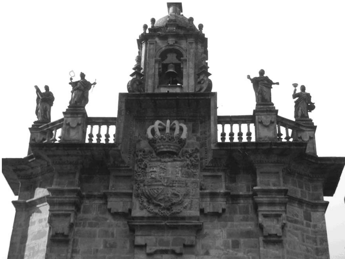
Campanario da Igrexa das Angustias