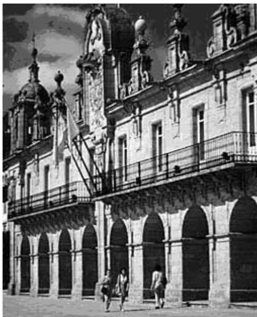
Casa do Concello. Lugo

Seguindo co devir cronolóxico da súa obra, no 1749, atopámolo traballando ó servizo das monxas bieitas de San Paio de Antealtares, para as cales realizará a galería do mosteiro (só a galería, xa que a parte inferior do edificio atribúese estilisticamente a Fernando de Casas).