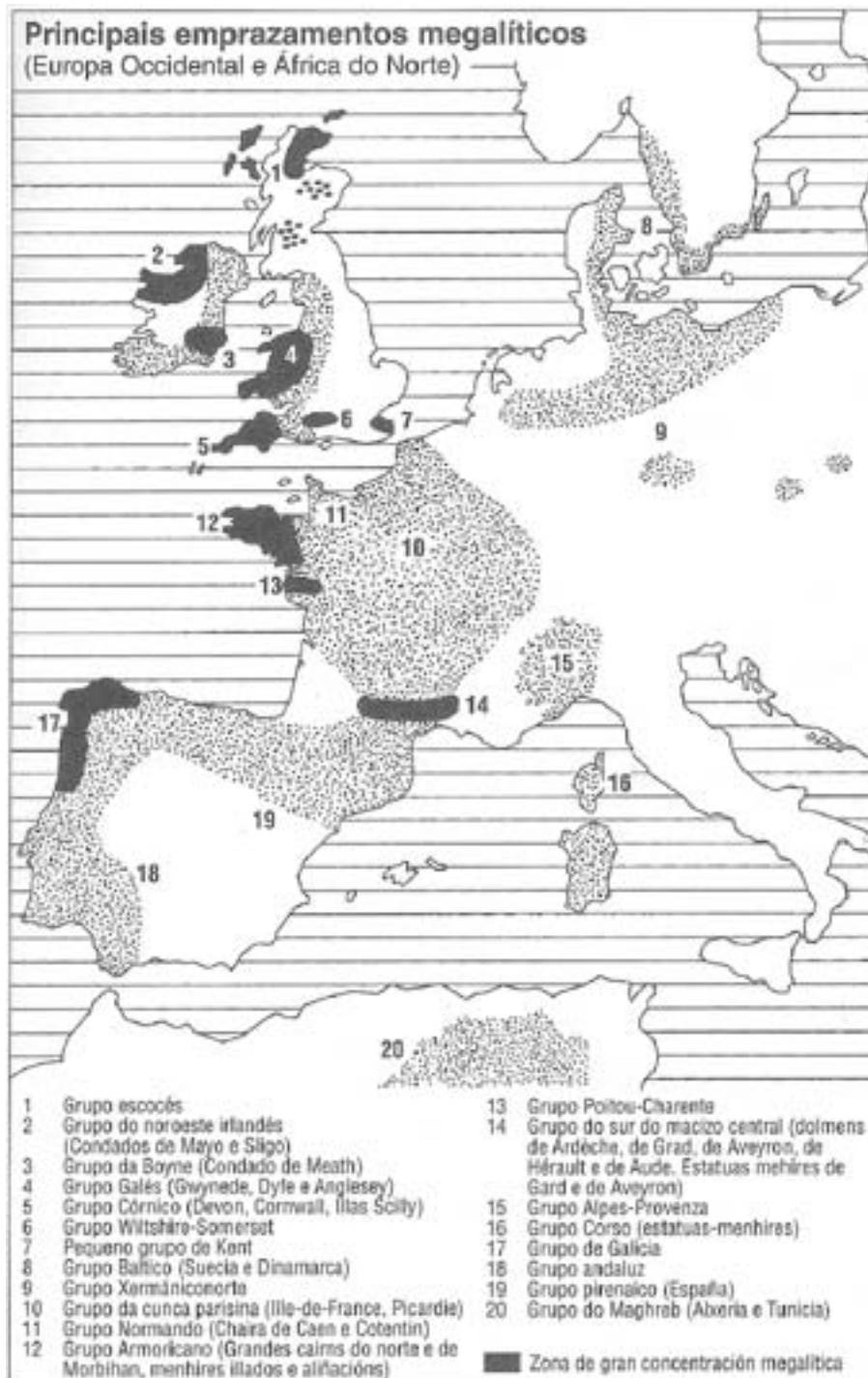
Difusión do megalitismo (Fte. Markale, 2000)

Seguramente o seu nome viñese de Arca da Vella, e segundo a lenda viñera ao país no tempo da guerra contra os mouros, o que, como logo veremos, a sitúa nos primeiros tempos.