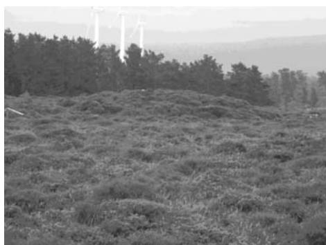
Mámoa na Serra da Loba

Tamén bastante coñecido por todos, aínda que no noso país non sexan actualmente moi abundantes, son os menhires (do bretón maen-hir , pedra longa). A palabra propia do galego para este tipo de pedras chantadas é pedrafita.